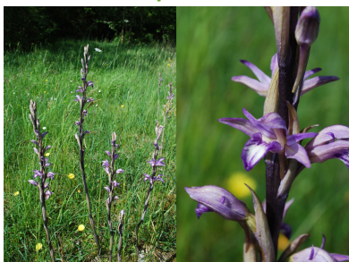
Limodore à feuilles avortées : cette orchidée puise ses nutriments sur les racines des arbres ! Elle n'a donc pas besoin de chlorophylle pour fabriquer ses nutriments : pas de couleur verte, et des feuilles réduites à des écailles.

Une orchidée dans mon jardin : Quelques conseils : retarder la tonte, ne pas cueillir les fleurs (organes de reproduction), ne pas déterrer/transplanter (cela ne marche pas à tous les coups), marquer l'emplacement avec un piquet, et les contourner lors de la tonte ! Si toute la surface du jardin est couverte, vous pouvez aussi délimiter des zones de retard de tontes, que vous laisserez pousser et ne viendrez faucher qu'après la floraison et fructification de vos belles orchidées.