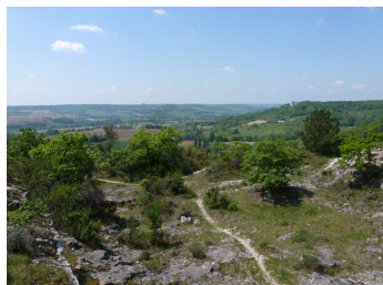
Vue sur la vallée depuis les coteaux