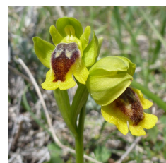
Céphalanthère rouge (à gauche) et Ophrys jaune (à droite), rares et protégées en Lot-et-Garonne.