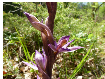
Limodore à feuilles avortées