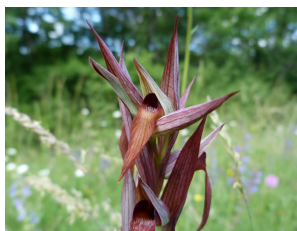
Orchis pyramidal (à gauche) et Serapias en soc (à droite) : au mois de mai, on les retrouve en nombre dans nos prairies, et même parfois sur les talus en bord de route !