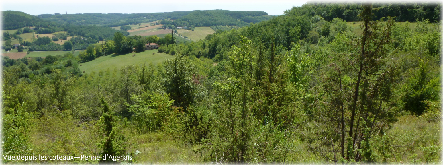
Vue depuis les coteaux — Penne-d'Agenais