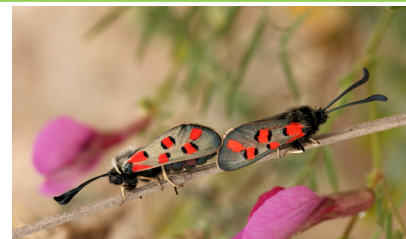
Couple de Zygènes cendrées, Lot - 2014

Lambert (Bruno), 2018. Zygaena rhadamanthus (Esper, 1789) dans le Lot-et-Garonne (Lepidoptera, Zygaenidae). Oreina , 44 : 33.