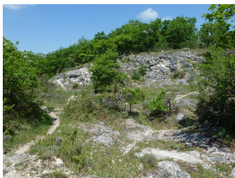
Pelouses sèches et zones rocailleuses