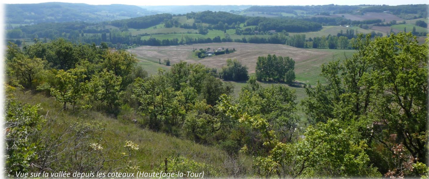
Vue sur la vallée depuis les coteaux (Hautefage-la-Tour)

La mission d'animation conjointe des sites Natura 2000 de Thézac et de Lascrozes, portée par les services de l'Etat, accompagnés par le Conservatoire d'espaces naturels d'Aquitaine (CEN Aquitaine) pour 3 ans, s'achève fin 2017. Voici donc venue l'heure du bilan avant le début du prochain cycle d'animation qui commencera en début d'année 2018 pour 3 ans. Au cours de cette phase d'animation, la remobilisation des fonds européens a permis le redémarrage du financement de contrats Natura 2000, ainsi que la mise en oeuvre des Mesures Agro-Environnementales et Climatiques (MAEC) destinées aux agriculteurs. Ces dernières ont suscité l'intérêt de nombreux exploitants et beaucoup d'entre eux se sont engagés en faveur de l'environnement à travers cet outil. Cela laisse entrevoir de belles perspectives pour l'avenir !