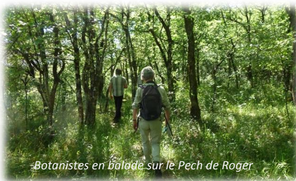
Botanistes en balade sur le Pech de Roger

Le cycle d'animation des sites de Thézac et de Lascrozes se termine au 31 décembre 2017. Un nouveau cycle de 3 ans démarre en 2018. Lors du COFIL (cf. ci-dessus), la DDT 47 a proposé aux collectivités de porter l'animation des deux sites pour les 3 prochaines années. Aucune collectivité n'a souhaité répondre à cette sollicitation. La DDT lance donc un appel à projet afin de désigner l'animateur Natura 2000 pour la prochaine phase d'animation 2018-2020.