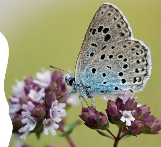
Azuré du Serpolet

Le pastoralisme est un atout pour la gestion des milieux sensibles tels que les pelouses calcaires. Les animaux pâturent et entretiennent un milieu où il est difficile de faire un entretien mécanique. Ainsi un pâturage par des moutons lorsqu'il est adapté permet d'éviter l'enrichissement et de conserver les milieux ouverts où les enjeux de préservation de la biodiversité sont importants.